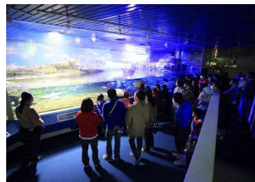
ナイトアドベンチャー