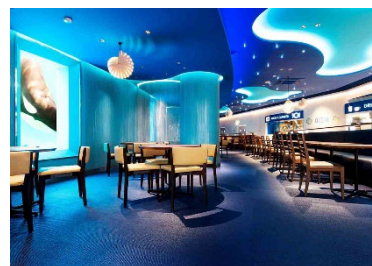
レストラン「オーシャン」